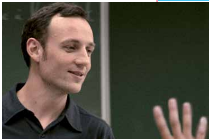
פרנסואה באגודו, מורה, תסריטאי ושחקן

האנומיה הערכית (המשתקפת באנומיה הארגונית) משתקת את ההנהלה (המנהל והמפקחת) ואת המורים. לא רק הגסות שבה התלמידים חוצים את הקווים משתקת אותם, אלא גם המבוכה הערכית-חינוכית; לא ברור להם למה הם מחנכים ומה הם רשאים ויכולים לדרוש מהתלמידים. "העולם שייך לצעירים", והמבוגרים